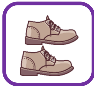
des chaussures (shoes)