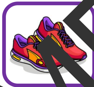
des baskets (sneakers)