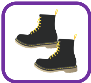
des bottes (boots)