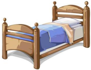
un lit (a bed)

Dans ma chambre il y a ... (In my bedroom there is ...)