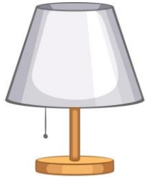
une lampe (a lamp)