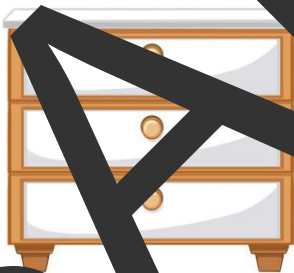
un commode (a chest of drawers)