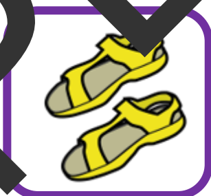
des sandales (sandals)