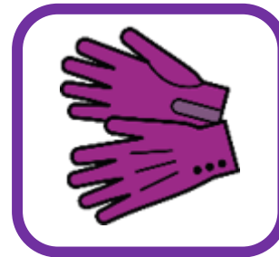
des gants (gloves)