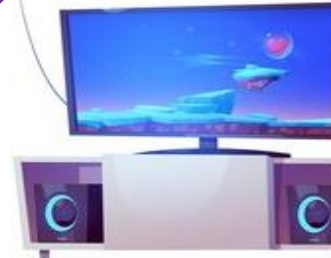
une télévision (a t.v.)