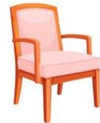
Une chaise (a chair)