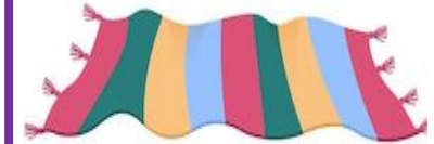
un tapis (a rug)