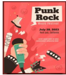
un poster (a poster)