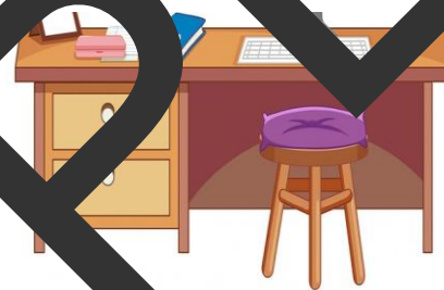
un bureau (a desk)